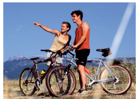
Balade à vélo