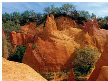
Cles carrières d'Ocre du Roussillon