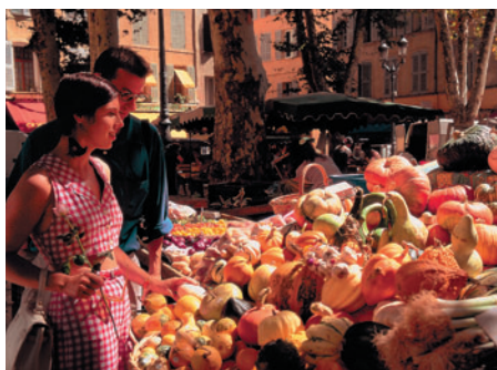
Les marchés de Provence