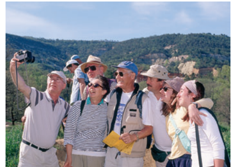
Randonnée en Luberon